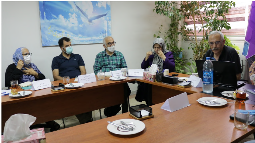
یکی از نشست‌های برگزار شده در دفتر بنیاد <