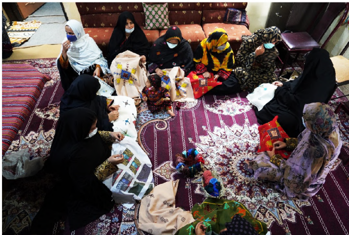
جلسه سوزن‌دوزی گروهی اعضا خانه هدی، شیرآباد، زاهدان