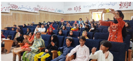
جشن آخر سال