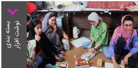
بسته بندی نوشت افزار