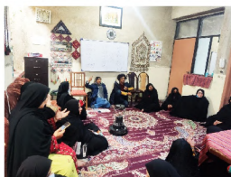
بعضی جلسات نگینی ما