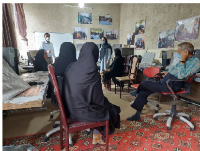
نمونه تعیین مشارکتی وضع موجود گروه خودیار

اصلی مدنظر اعضای بنیاد، این بوده که بتوان مسیر اقدامات را در روند بلندمدت و در قالب طرح توسعه خانه هدی در آینده نیز پیش برد تا ضمن بهبود مستمر فرایندها و توسعه خانه‌های هدی موجود، امکان تکثیر این الگو در سایر شهرستان‌های استان سیستان و بلوچستان و همچنین سایر استان‌ها فراهم شود. به همین منظور پروژه ای تحت عنوان پروژه توسعه خانه‌های هدی موجود تهیه و تنظیم گردید.