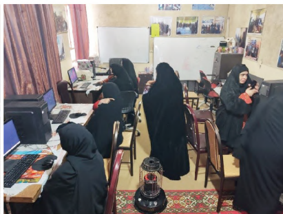
برگزاری کارگاه‌های آموزش مقدماتی اعضای گروه‌های خودیار