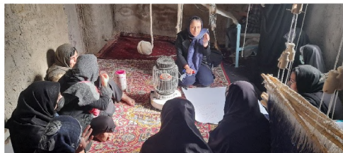
جلسات با گروه های خودیار