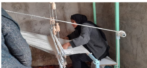
در حال کار اعضای گروه