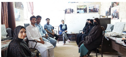
بخشی از تیم ما