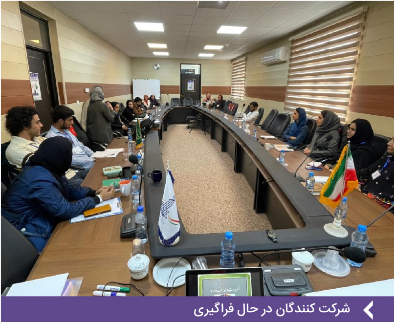
شرکت کنندگان در حال فراگیری