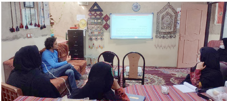
بررسی مشارکتی اساسنامه گروه‌های خودیار در هیات‌مدیره خانه هدی

نکته حائز اهمیت در این پروژه این بود که طراحی آن بر اساس مطالعه انجام‌گرفته پیرامون مستندسازی روایت خانه هدی شیرآباد انجام گرفت. هم‌افزایی صورت گرفته در خلال مطالعه مذکور میان اعضای خانه هدی، تیم کارشناسی و مشاوران اجتماعی و اقتصادی بنیاد، ظرفیت قابل قبولی را در طراحی مشارکتی گام‌های اصلی پروژه توسعه برای آغاز این مسیر فراهم کرده بود. به‌طور کلی ۷ گام اصلی پروژه از ایجاد فهم مشترک از ضرورت و چگونگی اجرای پروژه توسعه بین همه بخش‌های تیم، تا ارزیابی مشارکتی وضع موجود گروه‌های خودیار و خانه‌ای هدی، طراحی مشارکتی فرآیند بهبود و حل مسائل جاری، طراحی مشارکتی فرآیندهای توسعه سازمانی خانه هدی در قالب ۷ کارگروه بصورت تدریجی، طراحی مشارکتی بهبود و توسعه وضعیت کسب‌وکار و بخش‌های اجتماعی خانه هدی تا طراحی فرآیند نقش آفرینی خانه‌های هدی موجود در تکثیر این الگو در سایر محلات و شهرستان‌ها در نظر گرفته شدند.