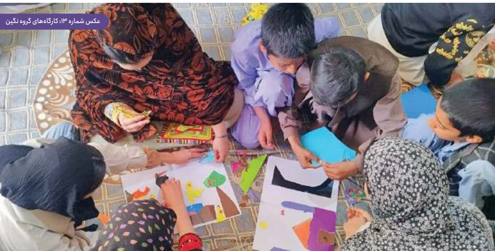
عکس شماره ۱۳: کارگاه‌های گروه نگین

در طول سال ۱۴۰۲ حداقل ۱۰ نفر از اعضای گروه نگین به عنوان مربی، تسهیلگر، کمک مربی، کتابدار، مستندنگار و سرویس کار سیستم‌های کامپیوتر خانه‌های هدی فعالیت کرده‌اند. در برنامه‌های مختلف با تهیه گزارش و فایل‌های مورد نظر نهادهای همکار، همراه بوده و در تیم‌های پروژه توسعه خانه هدی عضو فعال بوده‌اند و با نهادهای خارج از خانه هدی ارتباط گرفته و همکار پروژه‌هایشان شده‌اند. امید است آموزش‌های آنان را به نگین انتقال دهند.