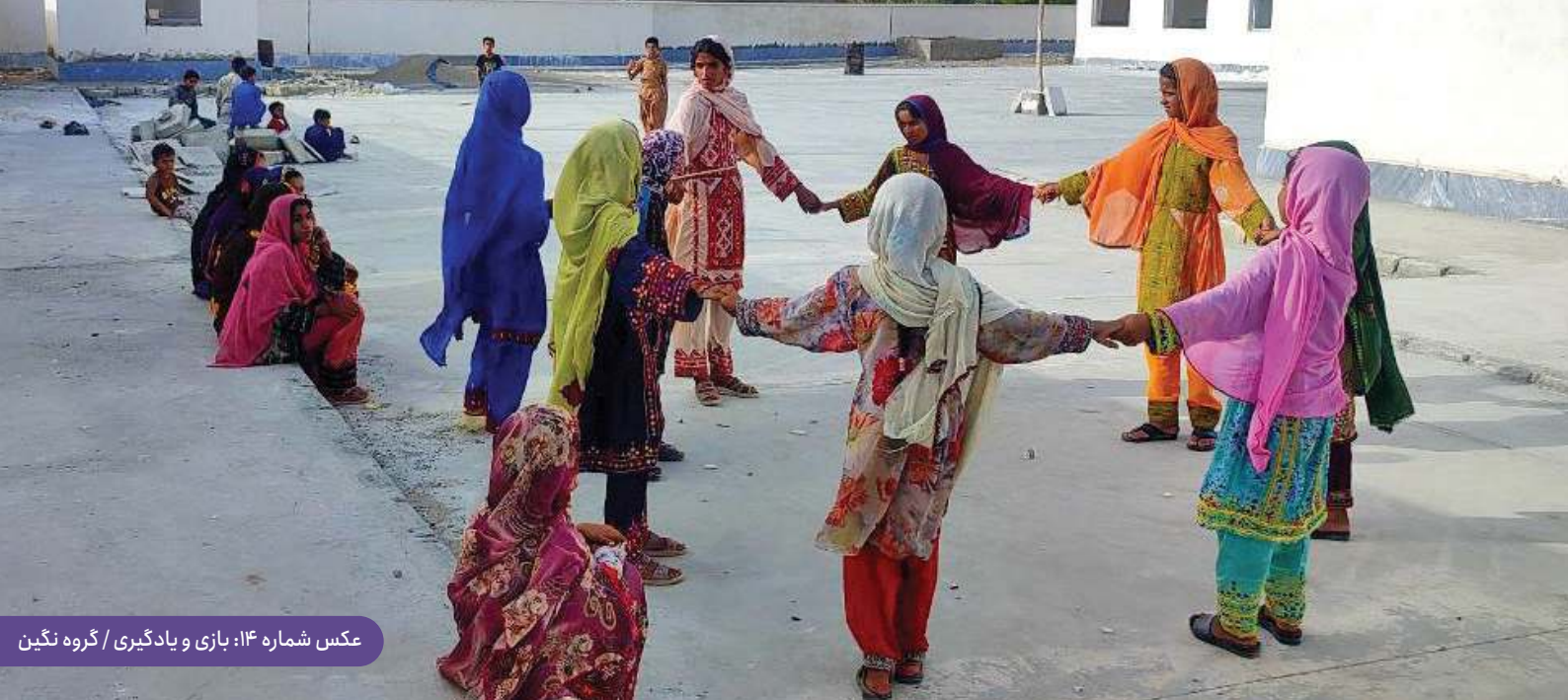
عکس شماره ۱۴: بازی و یادگیری / گروه نگین

کلاس‌های نقاشی، کاردستی، موسیقی، آشنایی با حقوق کودک، نوشتن خلاق، آشنایی با مبانی کامپیوتر و کتابخوانی برای گروه سنی ۷ تا ۱۱ سال و کارگاه‌های نقد فیلم، آشنایی با مبانی کامپیوتر، آشنایی با مهارت‌های کسب و کار، آشنایی با مشاغل، آشنایی با حقوق کودک، داستان‌نویسی، زبان انگلیسی و طراحی برای گروه سنی ۱۲ تا ۱۸ سال برگزار شده است. همچنین با توجه به اهمیت آموزش در گروه‌های سنی زیر دبستان، کودکان ۳ تا ۶ سال در کلاس‌های قصه و آواز و مجسمه‌سازی با خمیر بازی شرکت کرده‌اند. کارگاه‌های مهارت زندگی نیز در پاییز برای نوجوانان برگزار شد.