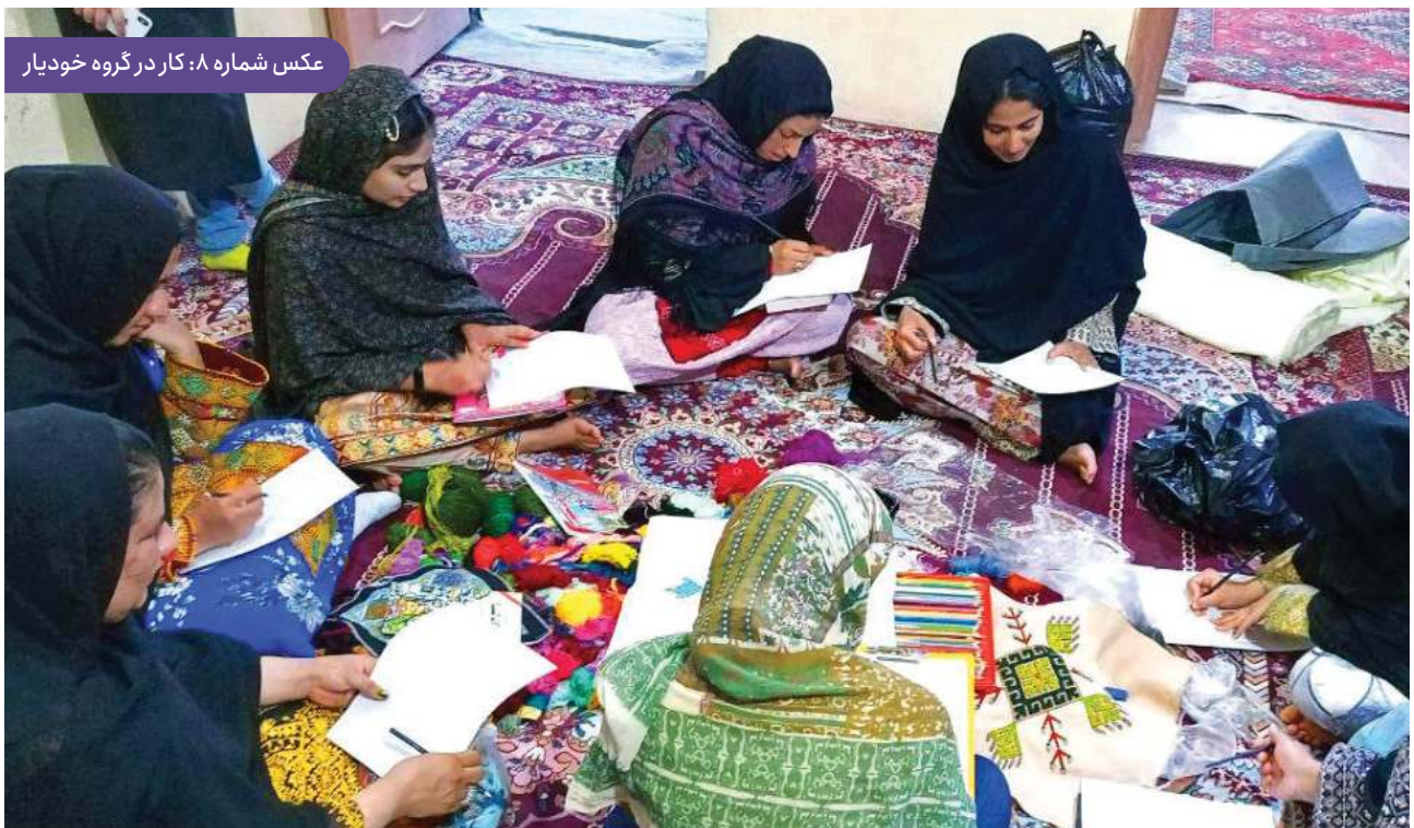
عکس شماره ۸: کار در گروه خودیار

شفافیت صندوق‌های پس‌انداز و به‌روزرسانی دفترچه‌های اعضا