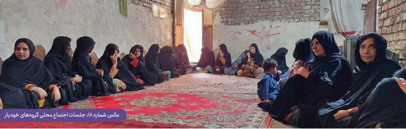
عکس شماره ۱۸: جلسات اجتماع محلی گروه‌های خودیار