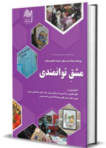
عکس شماره ۲۲: ویژه نامه مشق توانمندی

در سال ۱۴۰۲، متون مستخرج از مجموعه نشست‌های ترویجی که در سال ۱۴۰۱ در بنیاد برگزار شده بود، در قالب یک ویژه نامه با عنوان «مشق توانمندی» گردآوری، تدوین، بازنویسی و در دو قالب چاپی و الکترونیکی منتشر شد. همچنین متون مستخرج از نشست‌های برگزار شده در قالب نشست‌های «قوی‌تر در میدان» در سال ۱۴۰۲ نیز در قالب یک ویژه نامه مستقل تدوین شده است.