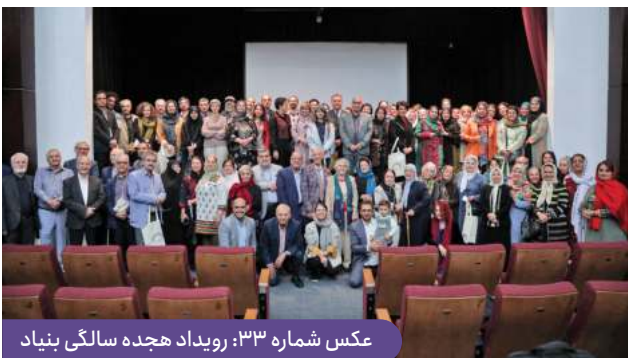
عکس شماره ۳۳: رویداد هجده سالگی بنیاد

بیش از ۳۰۰ نفر از حامیان فردی و سازمانی، داوطلبان، مدرسان و مشاوران، فعالان اجتماعی و سازمان‌های مردم‌نهاد، هنرمندان و پژوهشگران دانشگاهی، نمایندگان رسانه‌ها، تسهیلگران و همکاران محلی، اعضا بنیاد، و البته هیات مدیره و تیم کارشناسی بنیاد در این رویداد که در فضایی صمیمی و همدلانه برگزار شد شرکت داشتند.