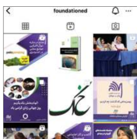
عکس شماره ۲۸: اینستاگرام بنیاد