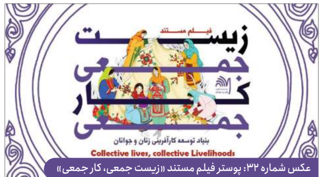
عکس شماره ۳۲: پوستر فیلم مستند «زیست جمعی، کار جمعی»