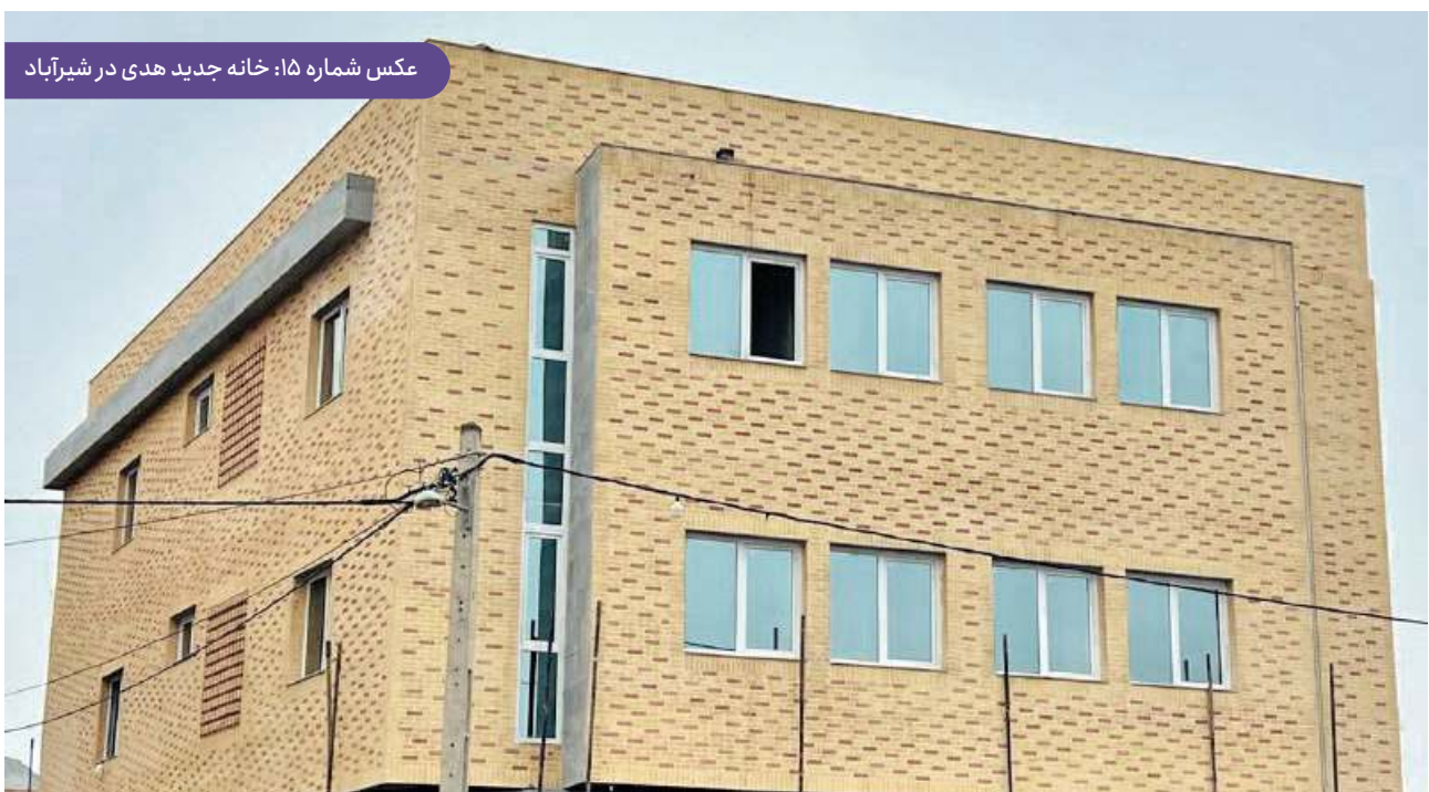
عکس شماره ۱۵: خانه جدید هدی در شیرآباد

اکنون نیز برنامه‌ریزی برای تجهیز امکانات و لوازم مورد نیاز بخش‌های مختلف بنا در دست بررسی و اقدام است.