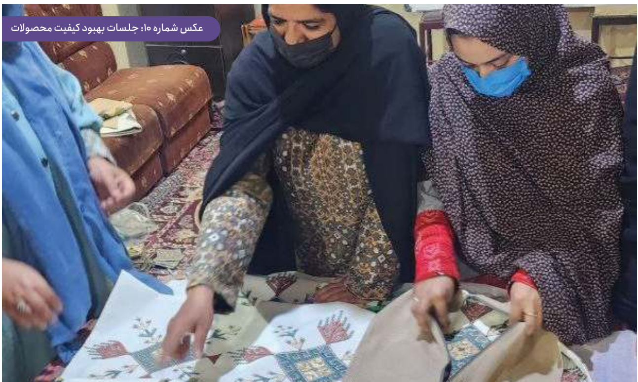
عکس شماره ۵۰: جلسات بهبود کیفیت محصولات

تثبیت برگزاری جلسات ماهانه سرگروه‌ها و منشی‌ها