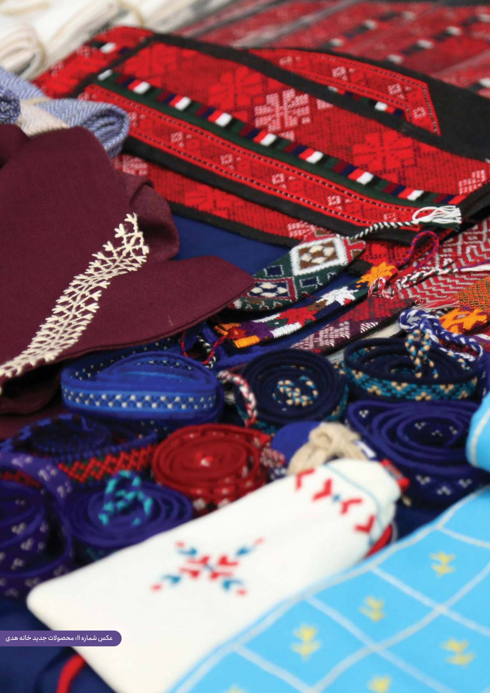
عکس شماره ۱۱: محصولات جدید خانه هدی