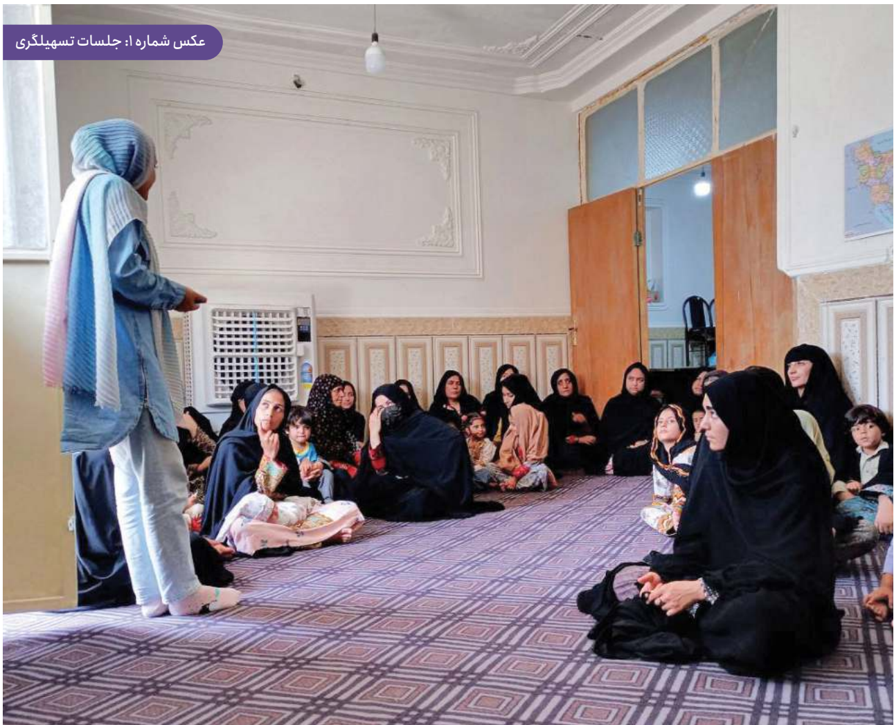
عکس شماره ۱: جلسات تسهیلاًگری

تمرکز بنیاد بر توسعه جوامع محلی در استان سیستان و بلوچستان از راه توان‌افزایی زنان، توسعه کسب‌وکارهای جمعی، شکل‌گیری گروه‌های خودیار و نهادهای محلی و کمک به توسعه و بهبود این نهادها و در نهایت تقویت ارتباط میان این نهادها با هدف معیشت پایدار و توسعه پایدار است.