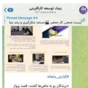
عکس شماره ۲۹: تلگرام بنیاد