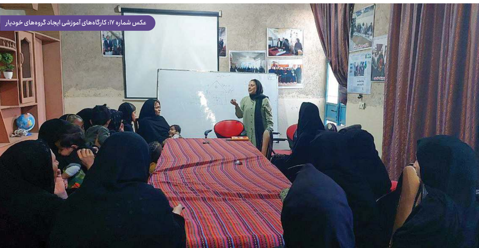
عکس شماره ۱۷: کارگاه‌های آموزشی ایجاد گروه‌های خودیار

بنیاد از بهار ۱۴۰۲ با این پروژه وارد بخش سیستان (زهک، زابل، نیمروز) و از پاییز سال ۱۴۰۲ وارد زاهدان شده است. جامعه هدف این پروژه زنان ساکن در مناطق کمتر برخوردار با تمرکز بر حاشیه شهرها و روستاها به همراه فرزندان ایشان است.