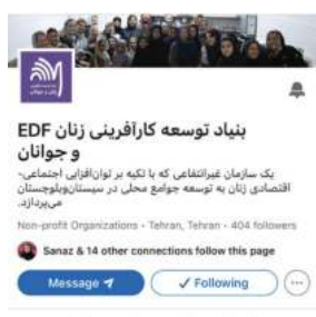
عکس شماره ۳۰: لینکدین بنیاد