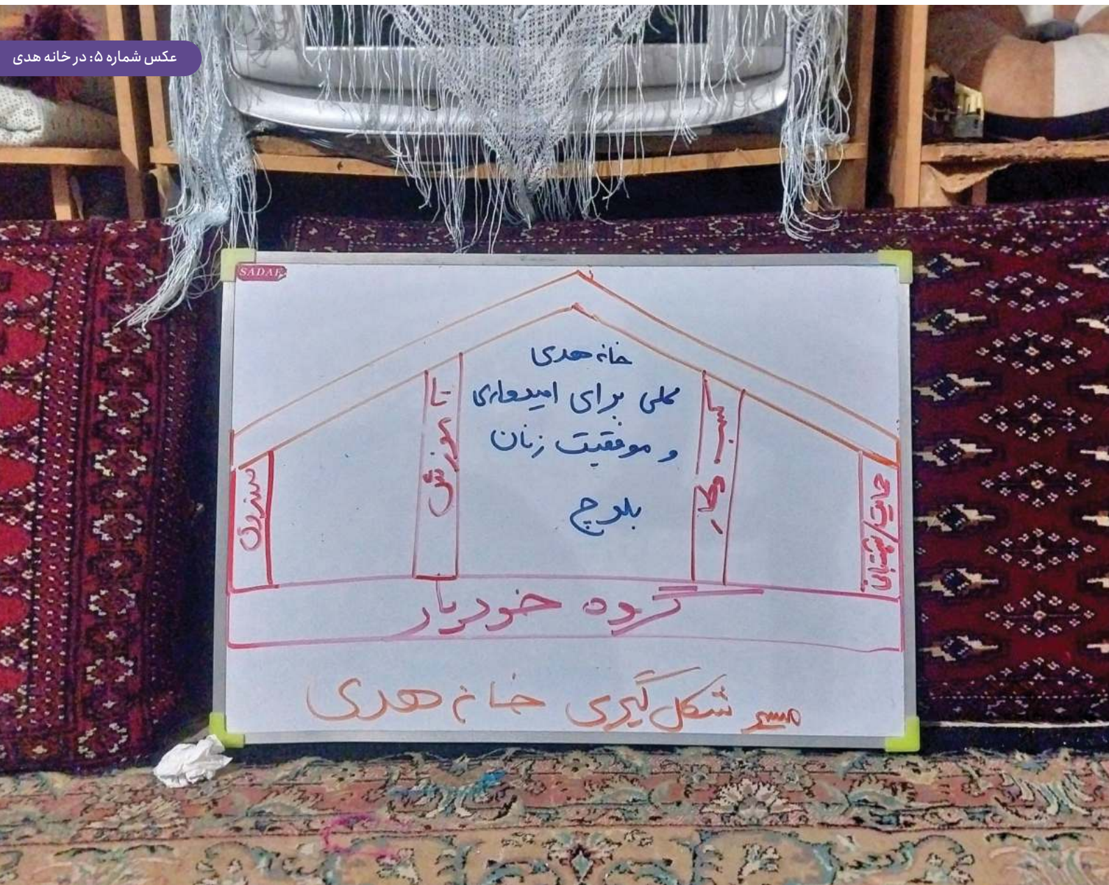
عکس شماره ۵: در خانه هدی